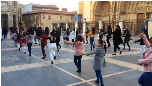
Celebración del Día de la Mujer (plaza de la catedral del León)