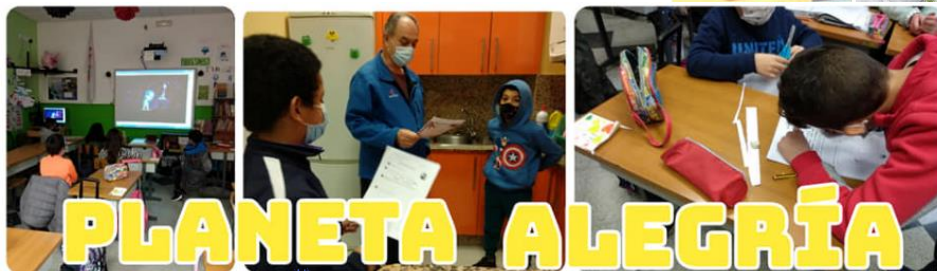
- Educación emocional ( vínculo )