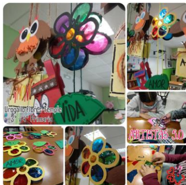
- Manualidades ( vínculo )

- Puertas cerradas, corazones abiertos ( vínculo )